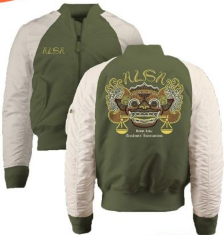
ALSA Barong Jacket