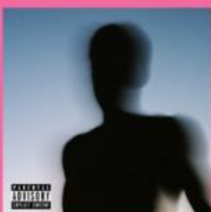
Artist : Daniel Caesar Album : CASE STUDY 01