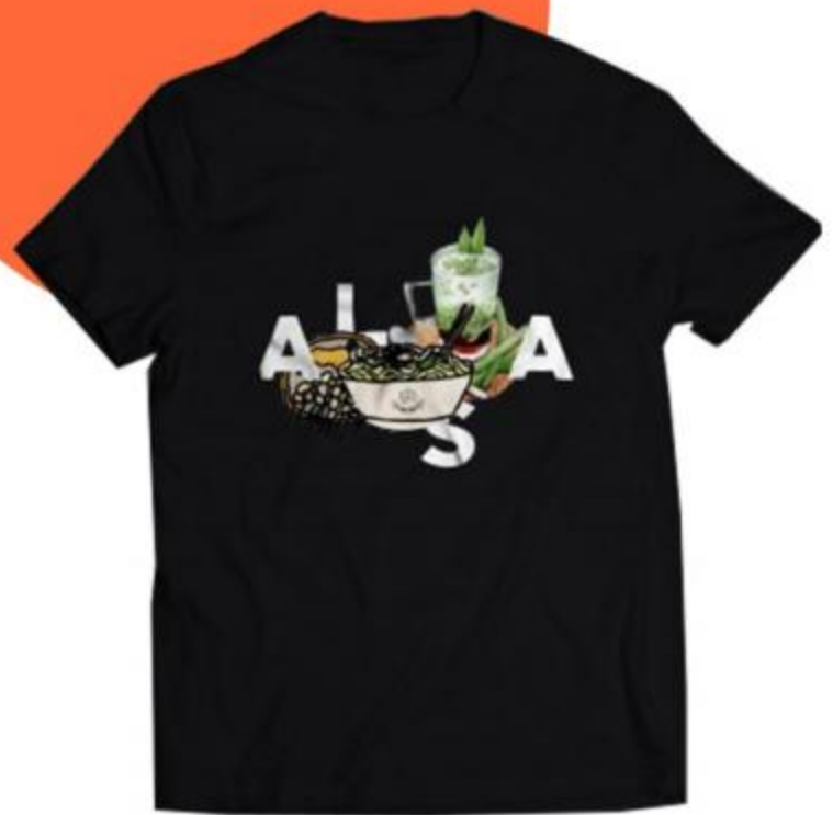
Cendol T Shirt