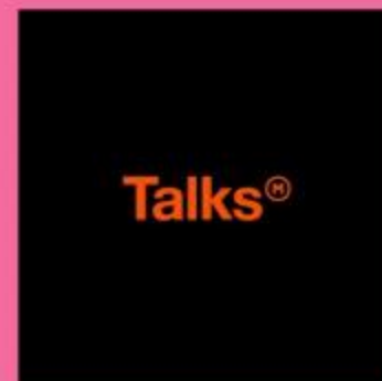
Podcast Makna Talks