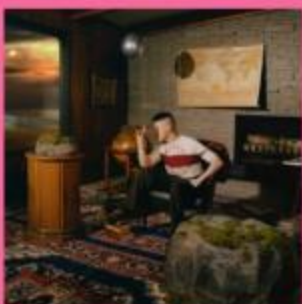
Artist : Rich Brian Album : The Sailor