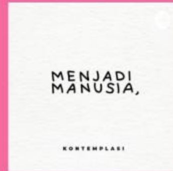
Podcast Menjadi manusia