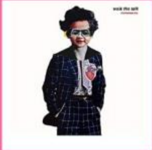
Artist : Pamungkas Album : Walk The Talk