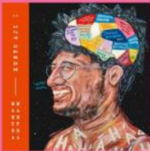
Artist : Kunto Aji Album : Mantra Mantra