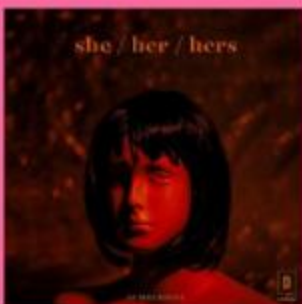
Artist : Svmmerdose Album : She/Her/Hers