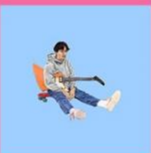
Artist : boy pablo Album : Soy Pablo